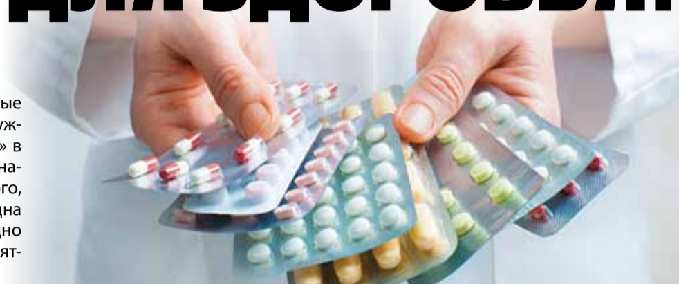
ТАБЛИЦА ДОРОГИХ ЛЕКАРСТВ И ИХ БОЛЕЕ ДЕШЕВЫХ АНАЛОГОВ

препаратов не тратятся огромные деньги, которые производителю нужно возвращать, а значит, «забывать» в конечную стоимость, бьющую по нашему с вами кошельку. Кроме того, есть у дешевых аналогов и еще одна приятная особенность – их невыгодно подделывать, поэтому меньше вероятность наткнуться на фальшивку.